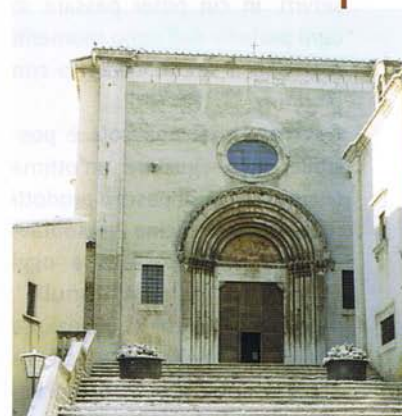
La basilica di Santa Maria del Colle a Pescocostanzo

sbalzo e soprattutto in filigrana con l'inserimento di pietre dure e coralli. Si producono soprattutto ciondoli, in particolare la ti-