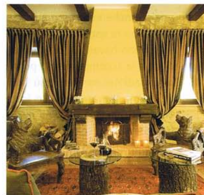
Un salotto per il relax nel Relais Ducale

Per informazioni: Relais Ducale Spa&pool Tel. 0864 / 642484 - 640018.