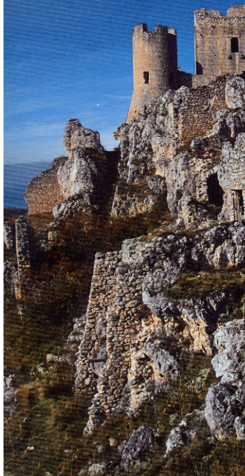
Sopra, il maestoso Castello Chiola, sul "balcone d'Abruzzo"; sotto, l'elegante Relais Ducale